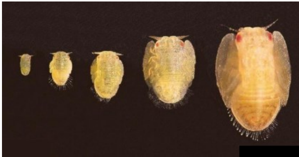
مشخصات مراحل نابالغ پسیل مرکبات: الف. تخم، ب. پوره سن اول، ج. پوره سن دوم، د. پوره سن سوم، ه. پوره سن چهارم، و. پوره سن پنجم، ز. انتهای پای عقب، ح. شاخک، ط. حلقه سوراخ مخرجی (بانگ ۱۹۸۴)

پوره ها در سن اول ۰/۲۵ میلی متر و در آخرین سن (سن ۵ پورگی) ۱/۵ تا ۱/۷ میلی متر طول دارند. رنگ آنها به طور کلی زرد مایل به نارنجی است و هیچ لکه شکمی وجود ندارد. پدهای بال ها (بالچه ها) بزرگ هستند. رشته های ترشحات پوره ها به صفحه انتهایی شکم محدود می شوند. پوره ها معمولاً ساکن هستند ولی در صورت تحریک حرکت می کنند. این ها از نظر ظاهری شبیه پوره شپشک های سپردار هستند ولی دارای بالچه های بزرگ می باشند.